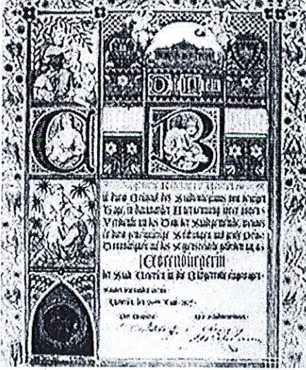
Ehrenbürger-Urkunde der Stadt Uetersen von 1879

Verleihung der Ehrenbürgerschaft der Stadt Dresden an Manfred von Ardenne 1989